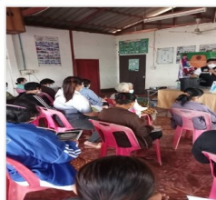
ภาพบรรยากาศการอบรมข...