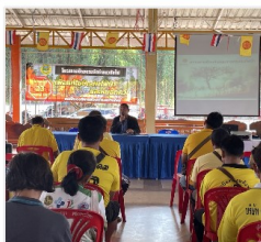
ภาพบรรยากาศโครงการจัด...